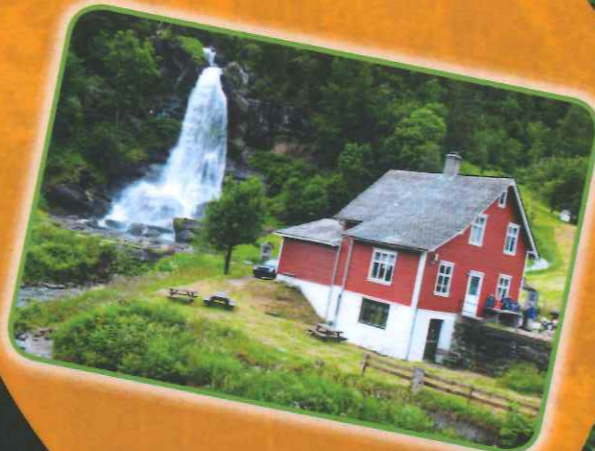
Gezellig Natuurlijke omgeving