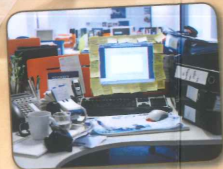
Bureau (over)vol persoonlijke spullen...