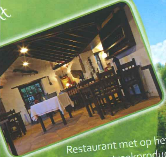
Restaurant met op het menu lekkere streekproducten in een eenvoudige bereiding.