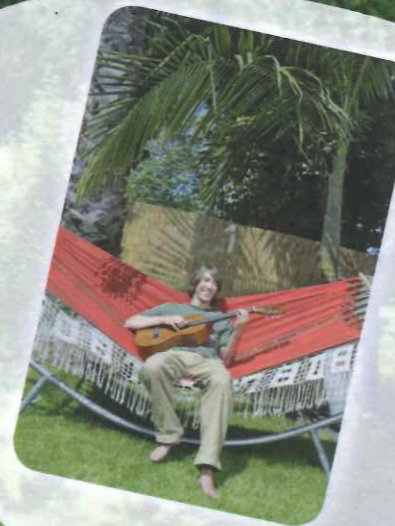
Epicurisme en van het nu genieten