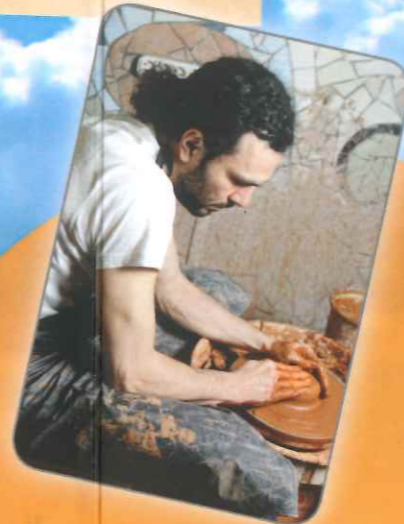
Met natuurlijke materie werken, met de natuur, de elementen, dieren... zonder druk